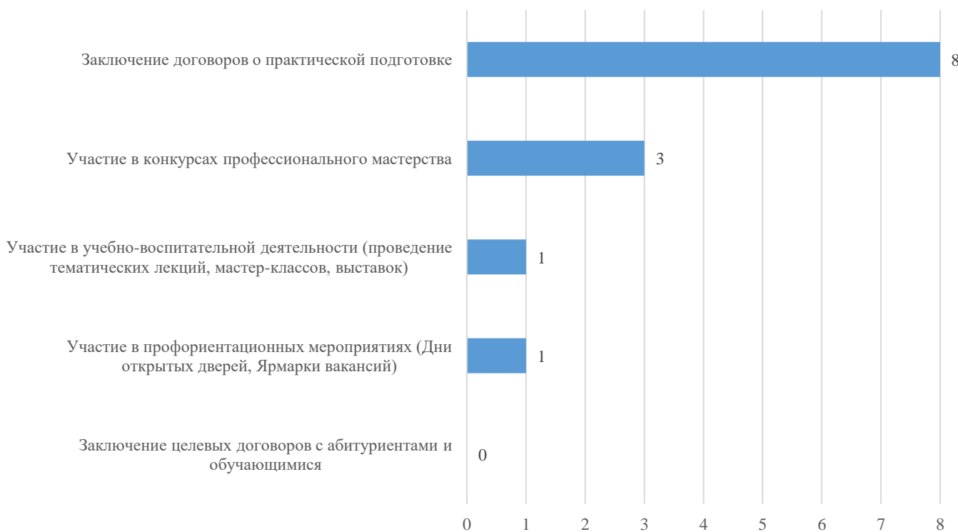
Готовность предприятий реализовывать различные формы взаимодействия с техникумом

Заключение целевых договоров с абитуриентами и обучающимися техникума опрошенные предприятия/организации не поддержали.